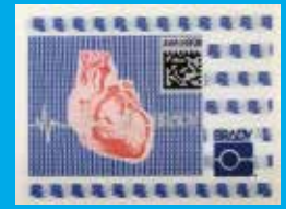
セキュリティラベルの一例

デモンストレーションおよびサンプルをご希望の際は、日本ブレイディ株式会社もしくは取扱代理店様までお問い合わせください。