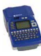
BMP™51ラベルプリンター 解像度: 300dpi

※BBP™16Eラベルプリンター、BBP™12ラベルプリンター、BMP™71ラベルプリンターで印字の際は、別途インクリボンが必要です。