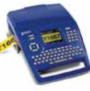
BMP™71ラベルプリンター 解像度: 300dpi