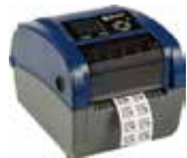
BBP™12ラベルプリンター 解像度: 300dpi