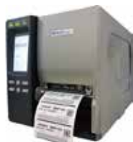
BBP™16Eラベルプリンター 解像度: 600dpi